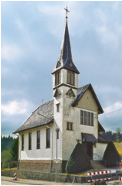
Seewald-Göttelfingen, Schernbacher Kirche.

Das Ensemble ist durch den Besuch Mörikes im Jahr 1862 geadelt und hat alle Eigenschaften, eine neue literarische Stätte für Baden-Württemberg zu werden. Voraussetzung war der Erwerb des Grundstücks für 171 000 Euro durch die Stadt Nagold. Die Denkmalstiftung beteiligt sich mit 40 000 Euro an dem Erwerb.