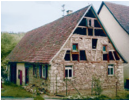
Hausen ob Verena, Einhaus.