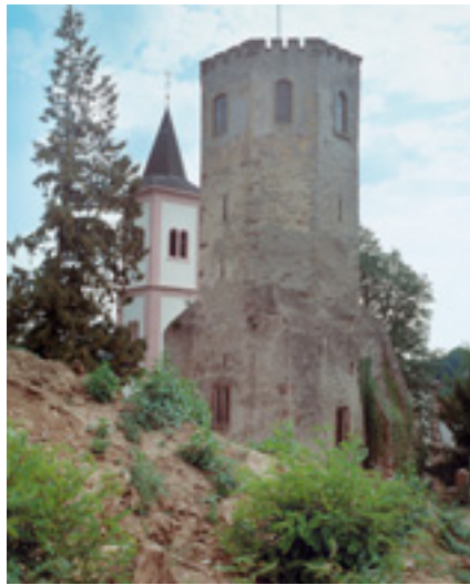
Gondelsheim, Alter Kirchturm.

Egon Eiermann war zwischen 1950 und 1970 Architektur-Ordinarius an der Karlsruher Universität und gilt noch immer als bedeutendster Baumeister der deutschen Wiederaufbaumoderne, berühmt geworden durch eine radikal neuzeitliche Ergänzung der kriegszerstörten Berliner Gedächtniskirche. Sein 1959/60 in Baden-Baden gebautes, denkmalgeschütztes Wohnhaus ist von höchstem gestalterischen Anspruch, allein wegen der Außenanlage mit ihren gestrichenen Ziegelmauern. Die müssen nun mit erheblichem Aufwand saniert werden. Bei Gesamtkosten von 120 000 Euro beteiligt sich die Denkmalstiftung mit 10 000 Euro an dieser Maßnahme.