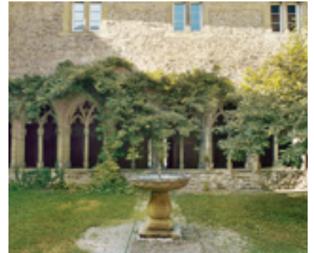
Bad Wimpfen, Stiftskirche St. Peter.