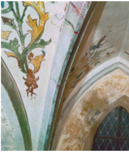
Riegel, Kapelle St. Michael.

1/2009 dargestellt. An der Raumschale muss indes weitergearbeitet werden. Hier ist 1953 zum letzten Mal Hand angelegt worden. Bei zuwendungsfähigen Kosten von 278 066 Euro beteiligt sich die Denkmalstiftung mit 50 000 Euro an diesem auch durch seine Öffentlichkeitswirkung herausragenden Vorhaben.