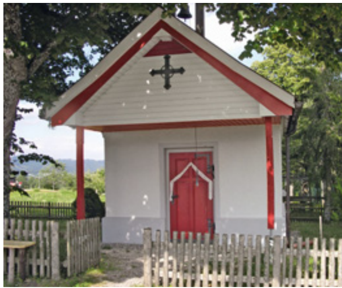
Isny, Kapelle Simmerberg.

Ostalbkreis AA, Böblingen BB, Biberach BC, Zollernalbkreis BL, Calw CW, Emmendingen EM, Esslingen ES, Freudenstadt FDS, Bodenseekreis FN, Breisgau-Hochschwarzwald FR, Göppingen GP, Rhein-Neckar-Kreis HD, Heidenheim HDH, Heilbronn HN, Karlsruhe KA, Konstanz KN, Hohenlohekreis KÜN, Ludwigsburg LB, Lörrach LÖ, Neckar-Odenwald-Kreis MOS, Ortenaukreis OG, Enzkreis PF, Rastatt RA, Reutlingen RT, Ravensburg RV, Rottweil RW, Schwäbisch Hall SHA, Sigmaringen SIG, Main-Tauber-Kreis TBB, Tübingen TÜ, Tuttlingen TUT, Alb-Donau-Kreis UL, Schwarzwald-Baar-Kreis VS, Rems-Murr-Kreis WN, Waldshut WT