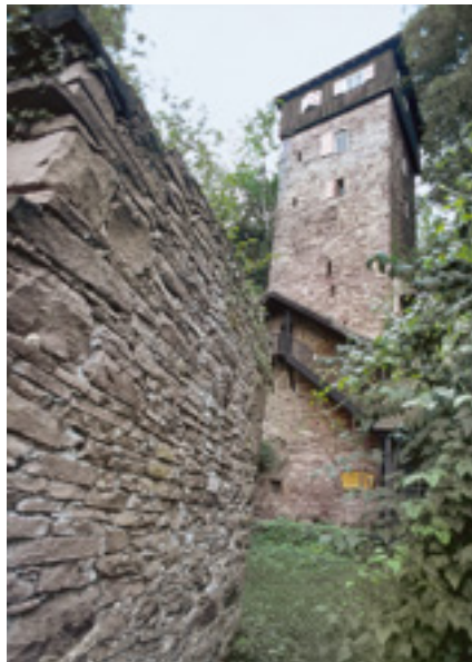
Binau, Burgruine Dauchstein.

1968 begann in Buchen die Stadtsanierung. Dabei fing man an, auch das ortsbildprägende Sichtfachwerk freizulegen. Im ge-