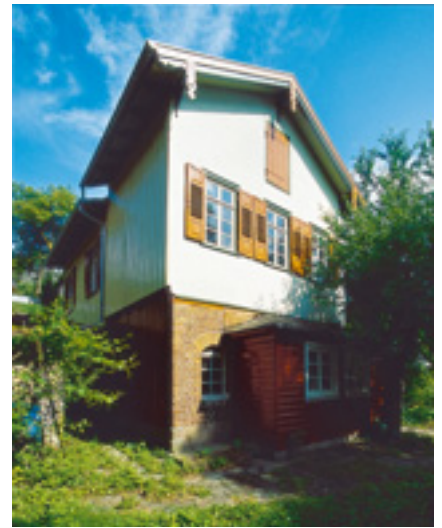
Nagold, Zellersches Gartenhaus.

nannten Gebäude sind allerdings im Giebel-fachwerk immer wieder Schäden entstanden, sodass die Eigentümerin den Giebel wieder verputzen wollte. Eine solche Maßnahme würde allerdings die ursprünglichen Sanierungsüberlegungen konterkarieren. Von den 5790 Euro zuwendungsfähigen Kosten übernimmt die Denkmalstiftung deshalb 5000 Euro.