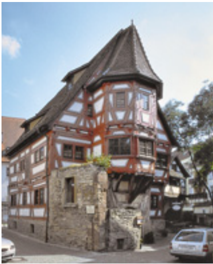
Stuttgart-Bad Cannstatt, „Klösterle“.

wurde 1463 erbaut. Beginen, also Ordensfrauen ohne lebenslanges Gelübde, nutzten es als Sozialstation. Insofern hat das „Klösterle“ eine ähnliche Herkunftsgeschichte wie das Tübinger Nonnenhaus (3/2008). Die Beginen wirkten bis 1541 in Cannstatt. Später, 1576, erhielt die Hauskapelle im ersten Stock ein stuckiertes Netzgewölbe, Zeichen für würdige Weiternutzung. Dann aber zerfiel der Bau. Erst sollte er 1937 abgerissen werden und dann wieder 1976, damals im Rahmen eines Sanierungsvorhabens. Doch 1980 erwarb es die Stadt Stuttgart und so fiel es in die Hände eines denkmalengagierten Architektenehepaars, das dem Klösterle wieder Leben einhauchte. Oben entstand ihr Büro und unten eine beliebte schwäbische Weinstube. Das ist 25 Jahre her. Nun stand wieder eine Fassadensanierung mit zuwendungsfähigen Kosten von 13 285 Euro an, woran sich die Denkmalstiftung mit 8000 Euro beteiligte und das Objekt im Oktober 2008 zum „Denkmal des Monats“ gekürt hat.