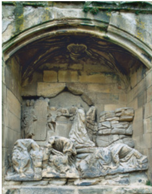
Lauffen a. N., Figurengruppe Regiswindiskirche.

Der „Dehio Baden-Württemberg I“ von 1993 befindet zu Lauffens ev. Stadtkirche St. Regiswindis: „Außen am Chor verstümmelte Ölberggruppe 1507“. Sie stammt von Hans Seyfer, einem bedeutenden Heilbronner Bildhauer, der auch die Kreuzigungsgruppen für Stuttgarts Leonhardskirche und den Speyrer Dom schuf. Seine Lauffener Arbeit soll schon im Bauernkrieg, spätestens aber im Dreißigjährigen Krieg angeschlagen worden sein. Nun aber mahnt die zuständige Konservatorin Angelika Reiff: „Wenn jetzt nichts unternommen wird, geht dieses wertvolle Kunstwerk über kurz oder lang verloren.“ Die Denkmalstiftung gewährt bei Gesamtkosten für die Rettung der Skulpturengruppe von 117 623 Euro eine Zuwendung von 30 000 Euro.