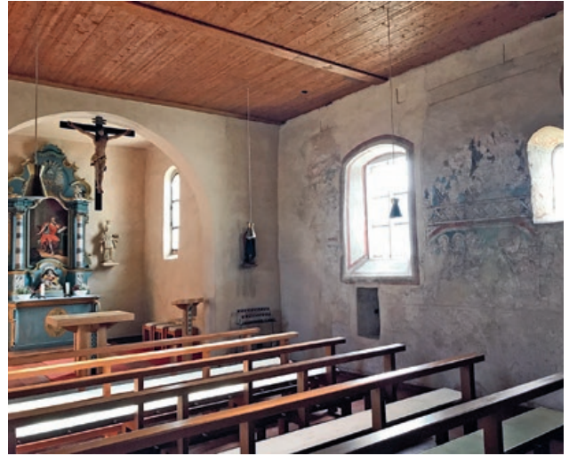
Bräunlingen-Mistelbrunn, Kapelle St. Markus.

ideal. Die Denkmalstiftung beteiligt sich an dem Projekt mit 50 000 Euro aus Mitteln der Lotterie GlücksSpirale.