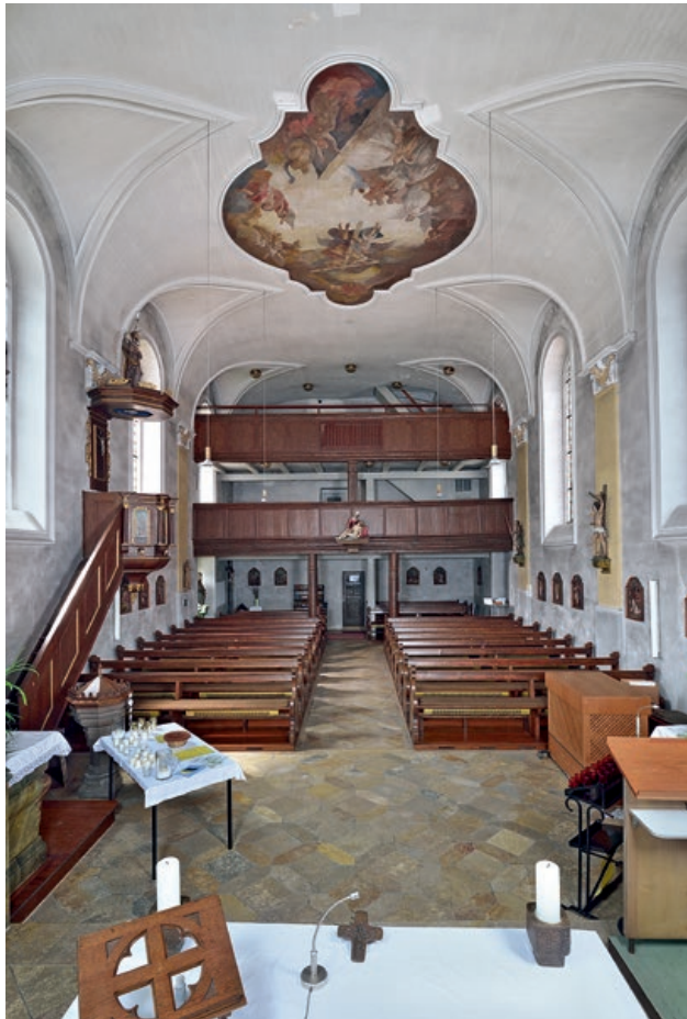
Mühlhausen i.T., Kath. Kirche St. Margaretha.

im Hof noch ein Stallgebäude errichten ließ mit querliegendem Wechsel von rotem und gelbem Klinker. Da die Natursteinfassade, besonders in den unteren Bereichen, feuchtigkeitsbedingte Schäden und teilweise ausgewaschene Fugen aufweist, sind nun eine Festigung der Oberflächen, das Schließen von Fehlstellen und die Anpassung abgängiger Bereiche geplant. Die Denkmalstiftung gibt für die Erhaltung dieses imposanten Gründerzeitmonuments 15 330 Euro.