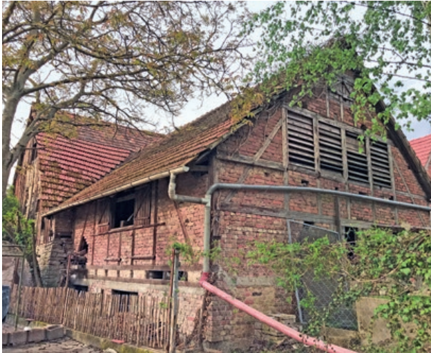
Bretten-Rinklingen, Hauptstraße, Scheune.

Arbeiten insbesondere am Dach, an Stein- und Schindelfassade, Fenstern, Türen, Dielen und der „gediegenen weiträumigen Einfriedung“, die das Anwesen umgibt, einen maßgeblichen Betrag aus Mitteln der Lotterie GlücksSpirale zu gewähren.