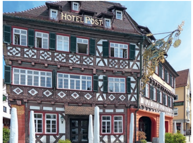
Nagold, „Alte Post“.

Der Bau mit seinem kräftigen Steinsockel und dem Fachwerkaufsatz überzeugt von außen mit der original erhaltenen Zugangstür von 1787. Im Inneren imponieren