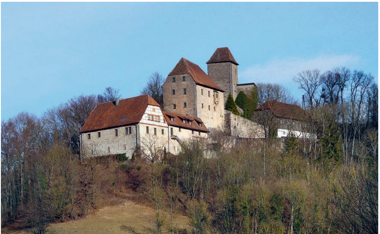
Braunsbach, Burg Tierberg.

Die Denkmalstiftung ist bereit, zur Rettung dieser architektonischen Wundertüte aus der Jahrhundertwende für