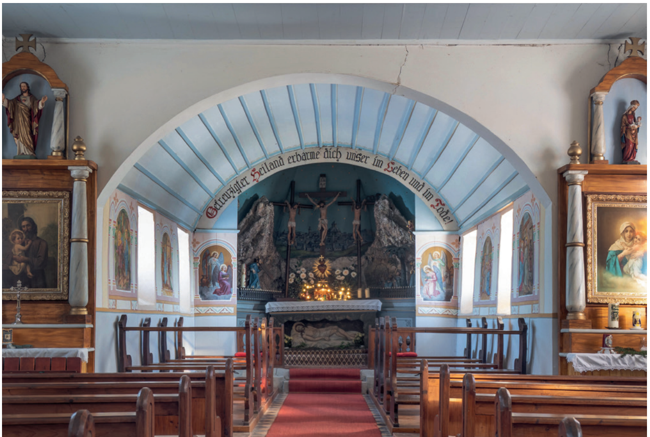
Das Hauptschiff mit der Tonnendachkonstruktion und sichtbaren Rissen in der Wand.

Nahezu 200 000 Euro hat die gesamte Sanierungsmaßnahme gekostet. „Wir hätten das nie finanzieren kön-