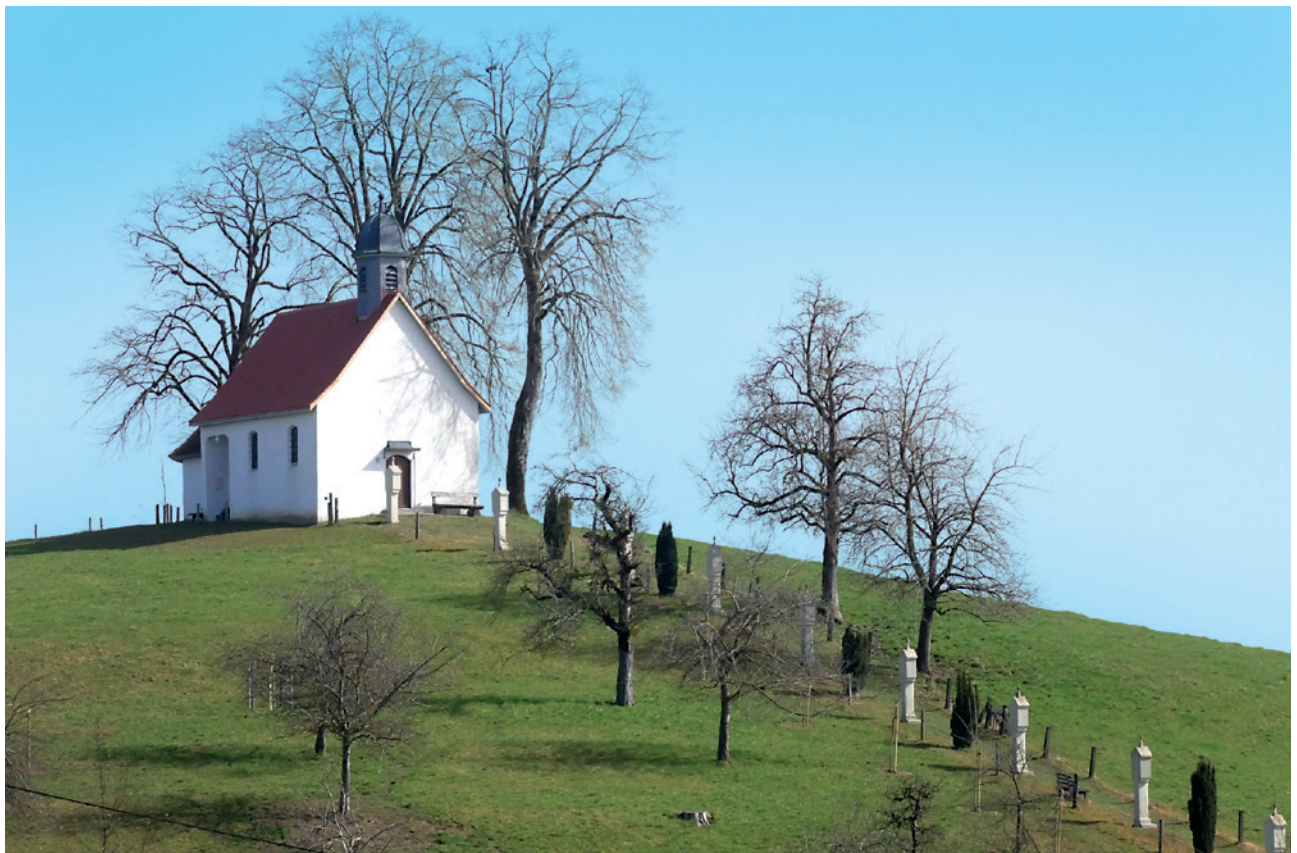
Kreuzweg und Kapelle – Volksfrömmigkeit, die weithin sichtbar ist.