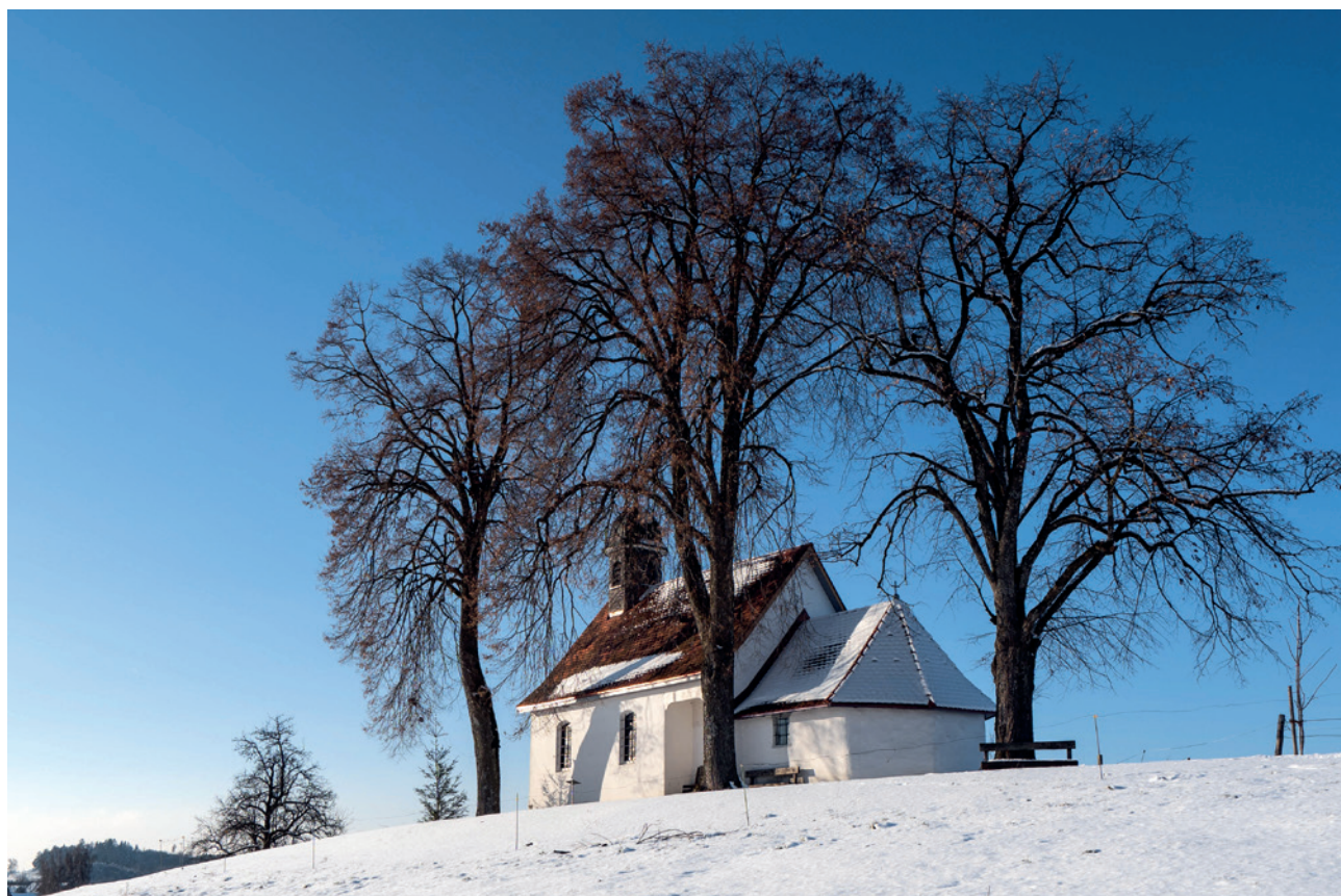
Die Kapelle ist zu jeder Jahreszeit einen Besuch wert. Große Schneemengen sind aber kritisch.

müssen jetzt noch gutachtlich feststellen, ob der Putz an der Westfassade komplett erneuert werden muss oder nur partiell.“ Klotz schätzt, dass noch einmal ein fünfstelliger Betrag fällig wird, bevor die Sanierung der Kapelle als endgültig abgeschlossen gelten kann. (ts)