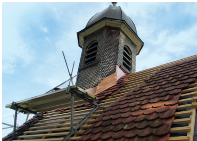
Sanierung des Glockenturms mit den Anschlussblechen in der Hauptfläche der Kapelle.

Die Sanierungsgeschichte der jüngeren Vergangenheit reicht bis in die 1980er Jahre zurück, als die Kapelle zum ersten Mal seit dem Erwerb durch den Großvater äußerlich instand gesetzt worden war. Damals übersah man offenbar bereits vorhandene Schäden am Chordach. 1997 wurde der Innenraum samt Ausstattung einer Sanierung unterzogen. Dabei wurden unter anderem zuvor übermalte Wandgemälde freigelegt.