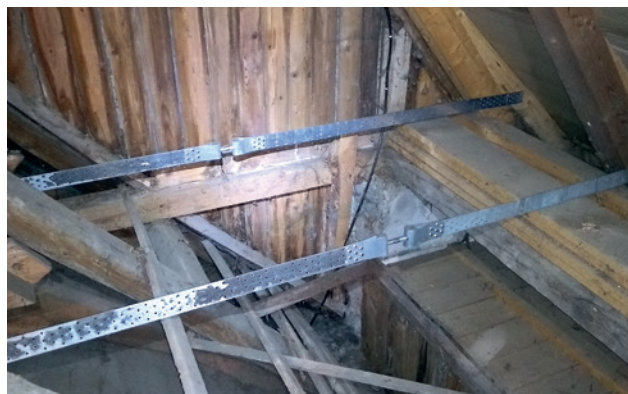
Notgesichert mit Stahlbändern – die Konstruktion über der Kuppel im Hauptschiff.