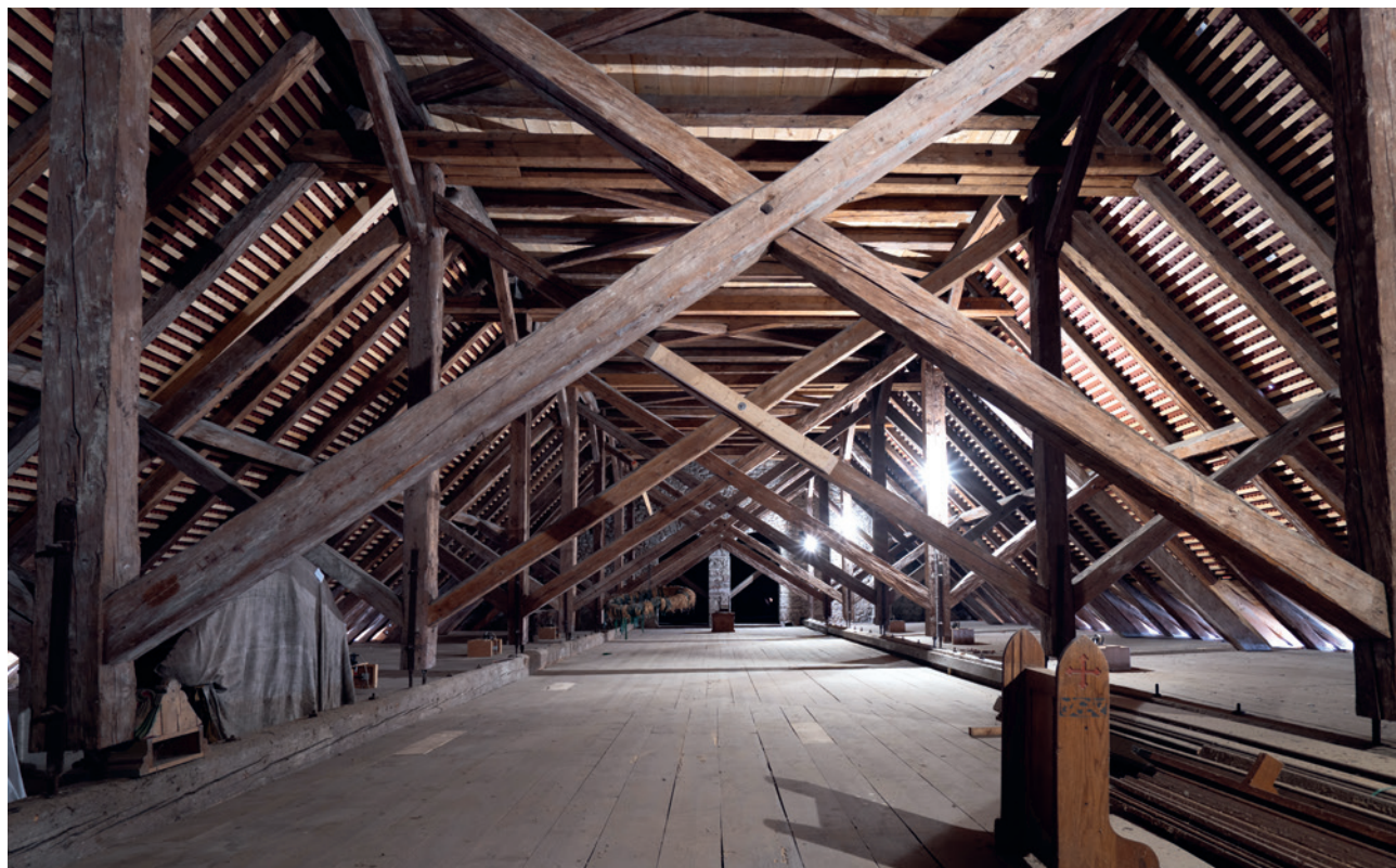
Innenansicht der Dachkonstruktion nach ihrer Sanierung.