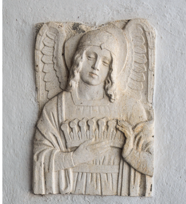
Engel am Denkmal für die Gefallenen des Ersten Weltkriegs an der Außenseite der Kapelle.

In naher Zukunft werden weitere finanzielle Mittel benötigt. Denn auch, wenn das Dach jetzt dicht ist und die Statik des Bauwerks wieder im Lot, ist die Sanierung noch nicht ganz beendet. Die Risse in den Wänden würden jetzt zwar nicht mehr größer werden, sie seien aber nach wie vor zu sehen, sagt Riether. „Wir