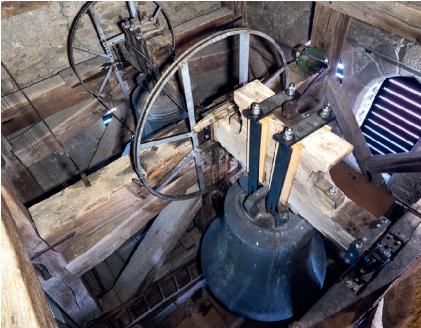
Neue Aufhängung für die Hauptglocke.

burger Kirchenbau heute sein unverwechselbares Gesicht gibt. Obwohl unbeschädigte Bestandsziegel sowie noch vorhandene Ersatzexemplare in die Neudeckung integriert wurden, lag der Bedarf an neuen Biberschwänzen freilich deutlich höher als anfangs prognostiziert, sodass dieser Posten das kalkulierte Budget massiv überstieg. Doch diese Investition lohnte sich: Dank der in Handarbeit in einer Manufaktur nahe Stuttgart hergestellten, historischer Formgebung folgenden und vorbildgerecht lackierten Keramik-Neuziegel leuchtet der Turm der Meersburger Kirche nun wieder in seiner bodenseeweit bekannten Schattierung.