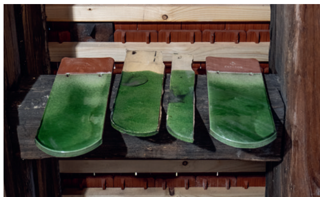
Alte und neue Biberschwanzziegel für die Deckung des Dachs.