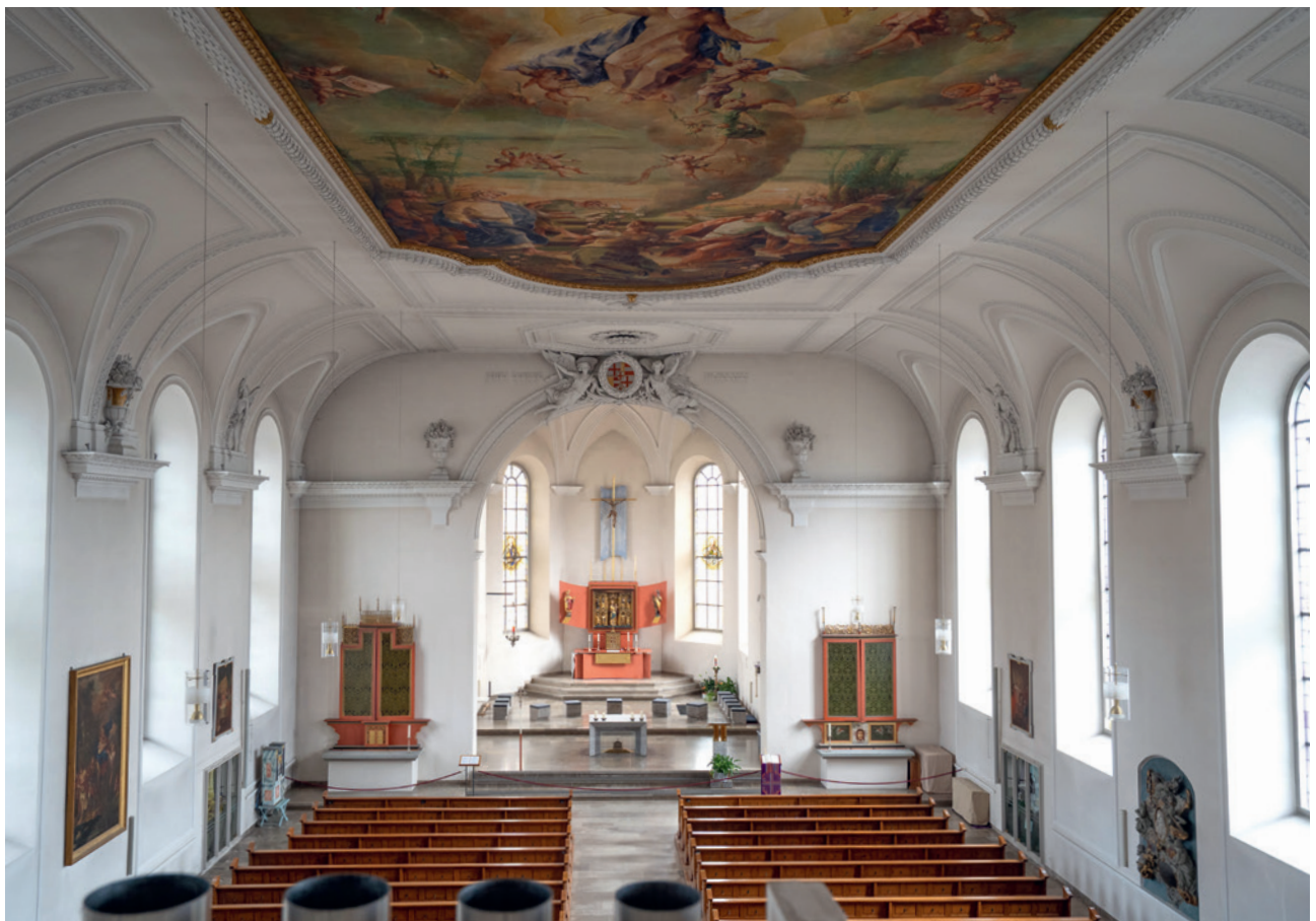
Innenansicht des im 19. Jahrhundert erbauten Haupthauses.

Verschärft wurde die Situation durch einen Sturm-schaden im Sommer 2023, was einen zeitnahen Beginn der Sanierung erforderlich machte. Dank eines zunächst milden Winters konnten die ersten Arbeiten noch im Dezember und Januar 2023/24 beginnen. Doch was in der Theorie überschaubar wirkte, entpuppte sich in Meersburg (wie bei vielen Bau- und Sanierungsmaßnahmen) als in der Praxis deutlich komplexer. Noch vergleichsweise einfach zu bewerkstelligen: die Erneuerung morscher Bühnenböden und der Austausch maroder Balken und Fachwerkbereiche. Deutlich mehr Aufwand bereitete die Stabilisierung des in sieben Ebenen unterteilten Turms: Auf mehreren Etagen mussten mehrgurtige Stahlverspannungen eingezogen werden, die den Turm nun quasi korsettartig einschnüren und fortschreitende Rissbildungen verhindern. Einen weiteren Schwerpunkt bildete die untere der beiden auf den Turmebenen 5 und 6 angebrachten Glockenstuben: die dort ihren Dienst verrichtende, viereinhalb Tonnen schwere Hauptglocke von Mariä Heimsuchung benötig-