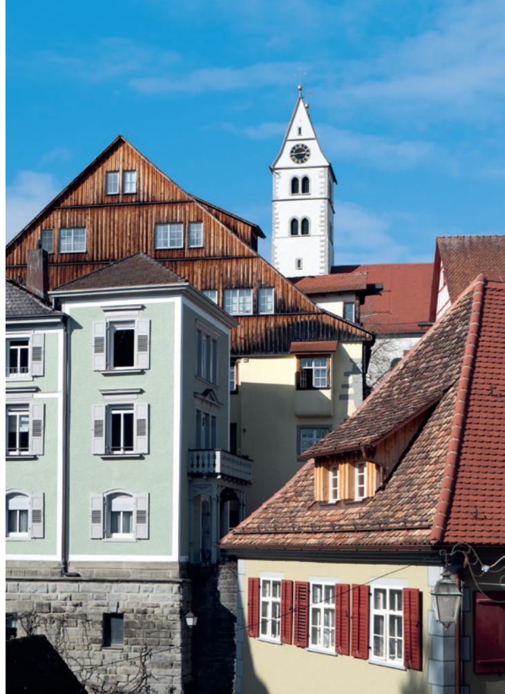
Die Schießscharte verrät: der Kirchturm ist ein ehemaliger Wehrturm.

Und diese Kirche hatte in ihrer Vergangenheit wahrlich keinen leichten Stand. Wo katholische Gotteshäuser ein paar Kilometer weiter mit der überbordenden Pracht des Oberschwäbischen Barock auftrumpfen, zeigt sich jene von Meersburg vergleichsweise nüchtern. „Früher hieß es bei unseren Nachbarn gerne: